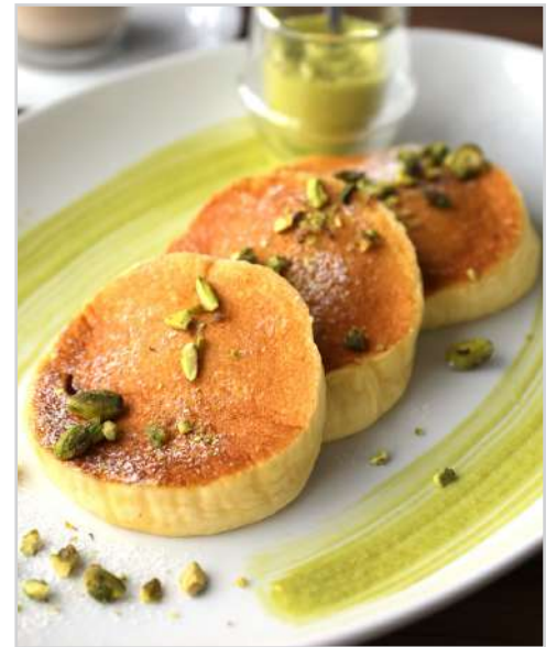
ピスタチオクリーム

イタリア「BABB I」のオリジナルレシピによる、芳醇なピスタチオの香りを感じられるリッチな味わいのスプレッドクリームを贅沢に味わえるパンケーキです。