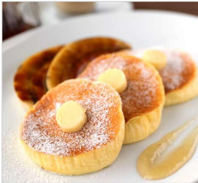
メープルシロップ &バナナのキャラメリゼ

※ご注文をいただいてから生地から作るため、20分ほどお時間をいただきます。予めご了承くださいませ。